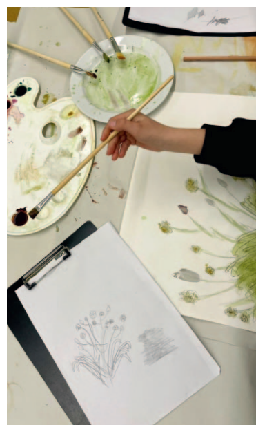
„Unser Färbergarten – Kunst aus Naturfarben“ / München