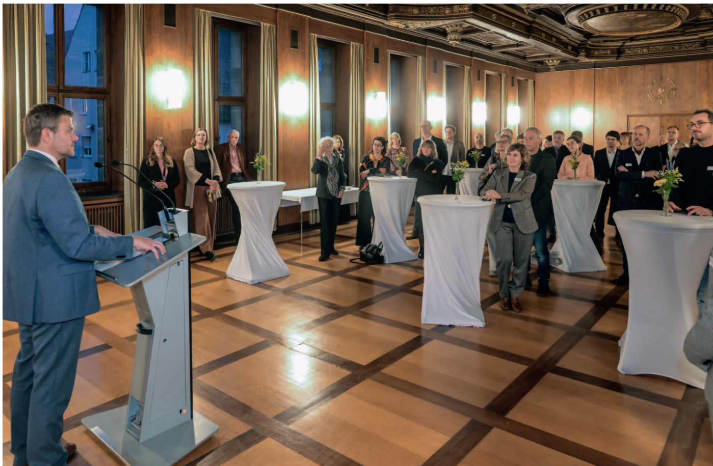
Empfang des Oberbürgermeisters der Stadt Nürnberg

Nach Grußworten von Vertreterinnen und Vertretern aus Politik, Verwaltung und dem Vorstand von STADTKULTUR Bayern wurden drei zentrale Themenfelder behandelt. Erstens Kultur ist Stadtentwicklung – Stadtentwicklung ist Kultur mit einem Input von Dr. Tobias