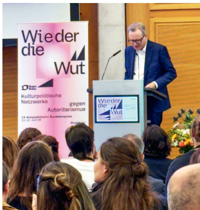
Keynote von Andreas Reckwitz

städte zwischen Teilhabe, Transformation und kultureller Verantwortung“ die langjährige Erfahrung und Perspektive von STADTKULTUR Bayern in den bundesweiten Diskurs ein. Eine Dokumentation ist auf der Kongressseite verfügbar.