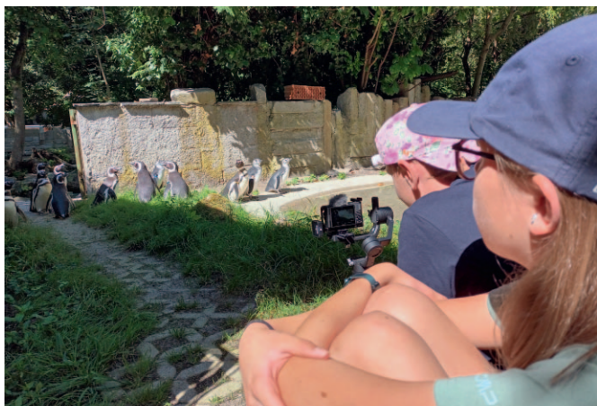
„Filmworkshop im Zoo“ / Augsburg

STADTKULTUR Bayern ist Teil der Wertebündnis-Initiative „ KlimabrauchtWerte “. Die Kulturellen Bildungsprojekte sind in der Sparte „ Klimabraucht Kultur “ verortet.