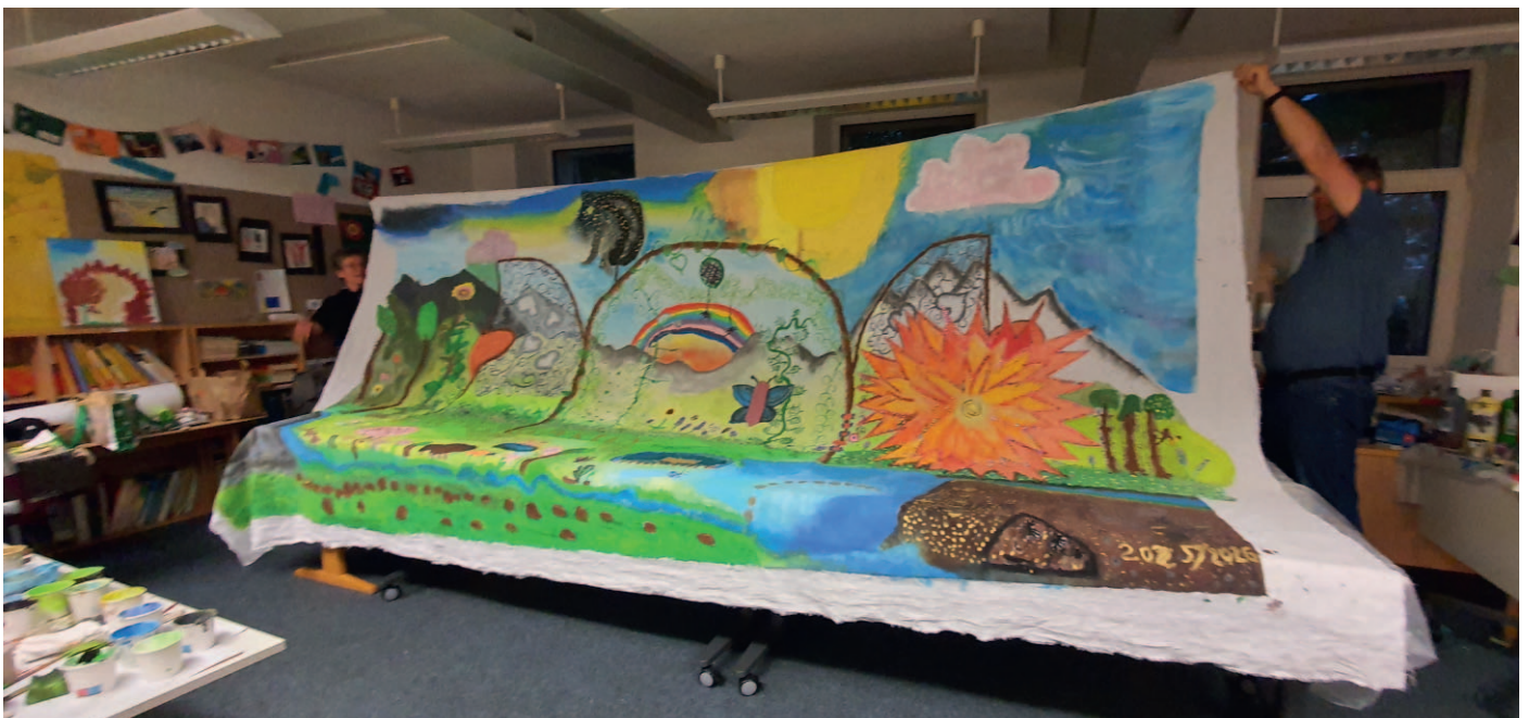
„Wunschgärten und Tafelfreu(n)den“/Schwabach