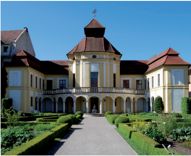
Garten der Anatomie, Ingolstadt

städtebauliche Bedeutung alter und neuer Gärten: Von der Neugestaltung des historischen Apotheker- über den Dachgarten des Campus St. Michael bis zur Umgestaltung der Bahnhofstraße in eine verkehrsberuhigte, blühende Verbindung zwischen den beiden Teilen des Stadtparks.