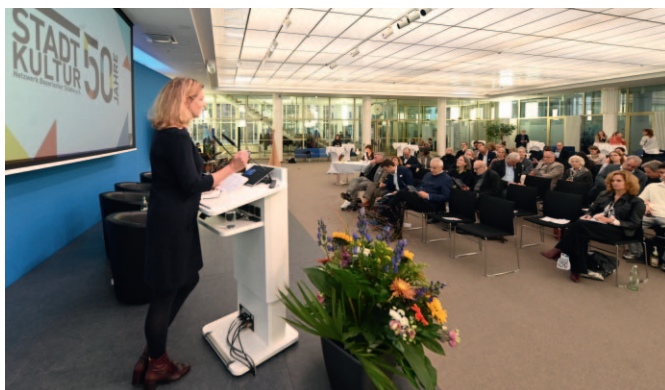
Symposium „Kultur für die Stadt - und darüber hinaus“